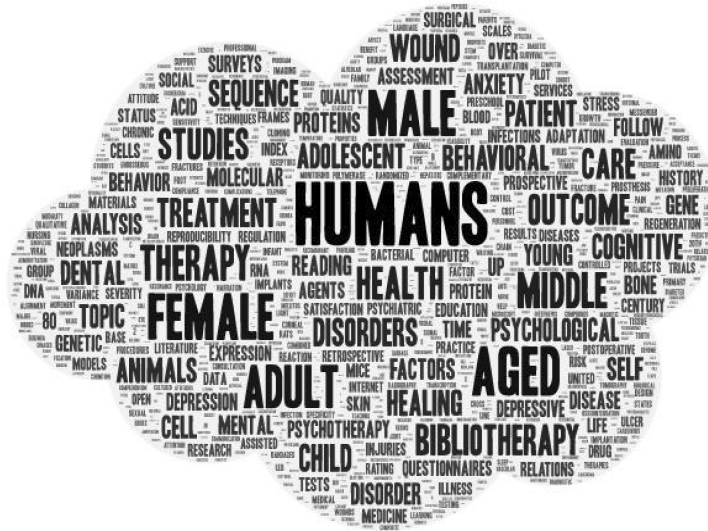
图3 迅速发展阶段高频主题词词云图

参考图3并结合文献原文,将这一时期国外阅读疗法研究特点归纳如下:(1)以医生主导的临床阅读疗法仍占主导。适应症广泛,包括失眠症、抑郁症、焦虑症等心理疾病,癌症、艾滋病等躯体疾病,以及学习障碍、自闭症等特殊问题。应用人群涵盖医院病人、老人、妇女、儿童等弱势群体,以及酒精依赖者、监狱犯人、军人、职场人士、警察等,覆盖社会各层面。(2)重视循证阅读疗法研究。过去,阅读疗法的方法学研究不足,导致诊断、疗效评价和预后转归存在较强的主观性和模糊性,定性指标多于定量指标,缺乏科学证据支持其疗效 [25] ,这对其科学性和有效性构成挑战,不利于推广。然而,此阶段高级别证据的系统评价和随机双盲对照试验研究文献数量显著增加,分别达到24篇和51篇,成果数量和研究深度均有大幅提升。具体而言,Nordin等的随机对照试验验证了阅读疗法对患者的有效性 [26] ;Rafiqi-Ferreira等的研究则为基于CBT的阅读疗法结合玩偶治疗儿童夜间恐惧症提供了初步支持 [27] 。这些研究为阅读疗法的科学性提供了有力证据,促进了其在临床和心理健康领域的应用。(3)在线阅读治疗研究。在线阅读治疗是“互联网+”时代出现的阅读治疗新模式。2020年,Stip Em-